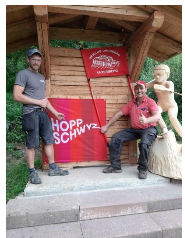
„Äs läuft öppis“

Verkehrsverein Unteriberg, co Gemeinde Unteriberg Waagtalstr. 27 CH-8842 Unteriberg Homepage: www.unteriberg.ch