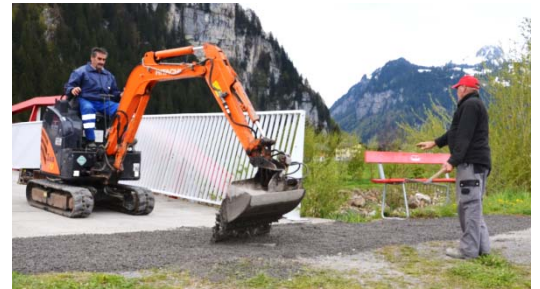
Wandergearbeiten Roter Steg