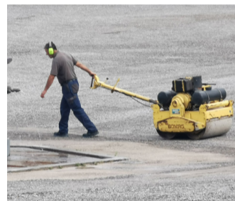
Auf dem Platz wird weiterhin gewalzt.

Die Beschwerden liegen auch dem Bezirk vor; aufgrund des laufenden Verfahrens will